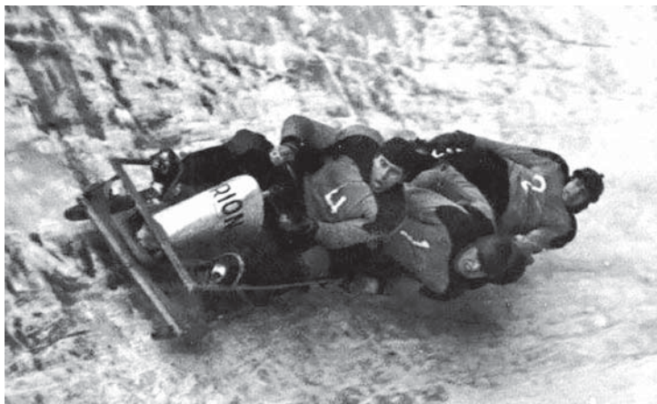
Po závodech jízda s diváky.

Na svazích kolem Mariánských Lázní vedly tři trasy, z nichž nejnámější mířila od hotelu Krakonoš až do Dusíkovy ulice. Počátkem 20. století byl založen Zimní sportovní klub. Bobová dráha měřila 1600 metrů a byla zprvu jedinou umělou v Československu. Nejlepší zajetý čas byl dosažen v roce 1929 1:41:20 min. Bohužel v roce 2001 byla bobová dráha zasypána a nyní se jí schází jen hrstka veteránů. Více se dozvíte v reportáži o bobistech na TVML.cz (DK)