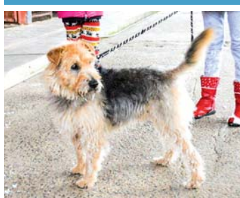
Zdravím Vás ze Psiho útulku Mariánské Lázně. Říkají mi Georg, jsem asi dva roky starý pesek, klidný, hodný a mám rád děti.