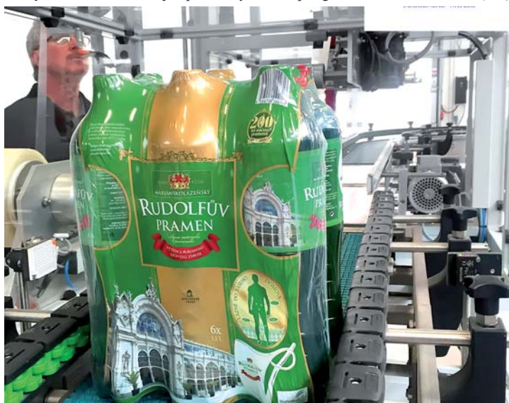
Stáčení Rudolfova pramene.

Které novinky připravujete na letošní rok? Na letošní rok připravujeme výrazné posílení stávajících distribučních kanálů a uvedení produktů AQUA MARIA a řady EXCELSIOR, a to jak pro běžný trh, tak pro gastronomii. (DK)