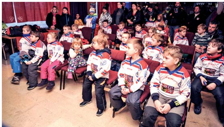
Ale že jim to v nových dresích sluší!

Úvodem byla celá akce pořádaná ČSLH představena včetně mariánskolázeňského klubu. Děti dostaly krásné reprezentační dresy a další dárky. Na ledě se jim věnovalo šest zkušených trenérů. Celkem přišlo 35 dětí s rodiči, kteří dostali podrobné informace o dalším možném zapojení do tréninku. Mírně se zúčastnilo 40 dětí a zůstalo jich hrát 18. Celkem je v mariánskolázeňském hokejovém klubu kolem 120 dětí do 18 let a z toho do 15 let je jich kolem 80, klub má celkem 190 členů. (DK)