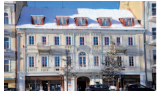
Dům Chopin čeká rekonstrukce.

(ptal se David Kurc, odpovídal starosta Petr Třešňák)