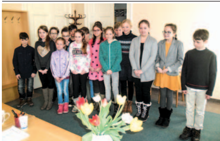
Soutěžící z 5. třídy.