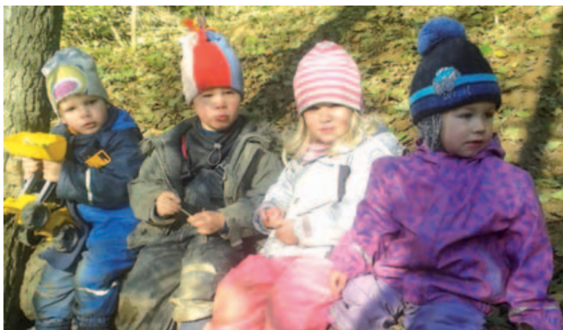
Spokojené dětičky v lesní školce.