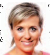
Hejtmanka Jana Vildumetzová.

Každý občan prostřednictvím krajských internetových stránek bude moci odeslat svou otázku, na kterou hejtmanka v krátkém čase