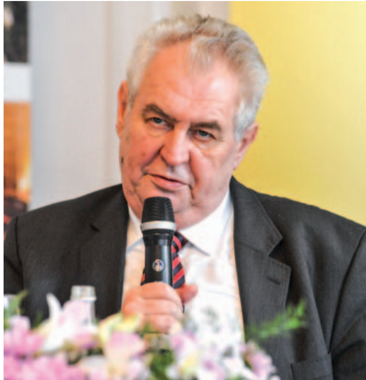
Prezident Miloš Zeman při poslední návštěvě v Mariánských Lázních.