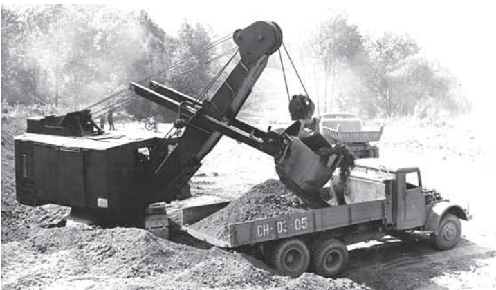
Stavba obchvatu na Karlovy Vary.