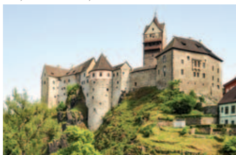
Hrad Loket.

Běžecký seriál Běžíme na hrad vstupuje do 4. ročníku. Připravili jsme pro vás pět zastávek na následujících hradech: 20. 5. Točnick, 3. 6. Bouzov, 26. 8. Veveří, 9. 9. Kunětická hora a 23. 9. Loket.