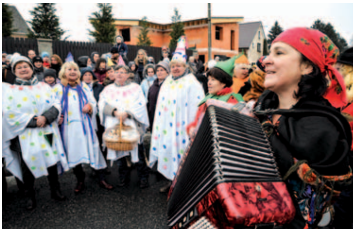
Masopustního veselí se zúčastnili snad všichni obyvatelé Drmoulu.