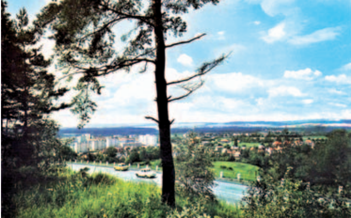
Panorama Úšovic, foto Jiří Hepner.

Černobílý snímek jsem pořídil někdy roku 1963. Bylo to v počátku stavby. Obchvat stále v původní trase napojuje Plzeňskou na vyústění průběžné silnice probíhající Závišínem. Na trase se stavěly dva železobetonové mosty: podjezd tratě na K. Vary a podjezd silnice do Vlkovic. Snímek je z místa blízko budoucího podjezdu tratě, pohled směrem do Úšovic. Vpravo byl hřbitov, který zčásti (vcelku bezohledně) padl za obět obchvatu. V dále se rýsuje pravá zatáčka dolů. Zeminu odvázejí nákladní Tatra 111, ceněné dodnes jako výkonná vozidla. Tatra má na postranicích CH-03-05. Tak se tehdy psala RZ také na korbu, dle sovětského vzoru. Asi kdyby řidič někam zajel načerno. - Další snímek je pohled na Úšovice z oblouku obchvatu, pořízený pro soubor pohlednic Jiřím Hepnerem, někdy kol roku 1975. Pro nárůst stromů nelze pořídít srovnávací snímek. - Po roce 1970 se diskutoval jiný obchvat, z Plzeňské kolem kasáren, mezi nádražím a Hamrníky, ústící za Hledšebí do silnice na Cheb. Kvůli nedostatku financí nápad zapadl, i když pozemky byly drženy v rezervě. Dnes příkladně přetížení Chebské je enormní, povolovaly se obchody, nárůst dopravy se bagatelizoval. Černobílý snímek, archiv, text Václav Kohout