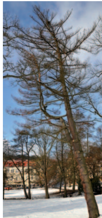
Borovice vejmutovka u Labutího jezírka.