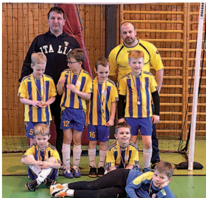
Mladší přípravka se svými trenéry.

Po několika umístěních na „bedně“ se tentokrát nejmladším reprezentantům nepodařilo vybojovat medaili. Na turnaji v sálové kopané, který se konal v sobotu 4.2. v hale Slovanu M.Lázně v Tyršově ulici, obsadili 4. místo. V dresu Viktorie nastoupili: Hera, Staňko, Brabec, Holeček, Čep, Šmejkal, Šmolcnap.