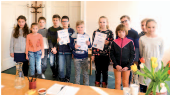
Soutěžící ze 4. třídy.

Vítězové se 3. března 2017 zúčastní celokrajského kola, které se bude konat v Krajské knihovně Karlovy Vary. Budeme jim držet palce. (K. Trollerová, řed.)