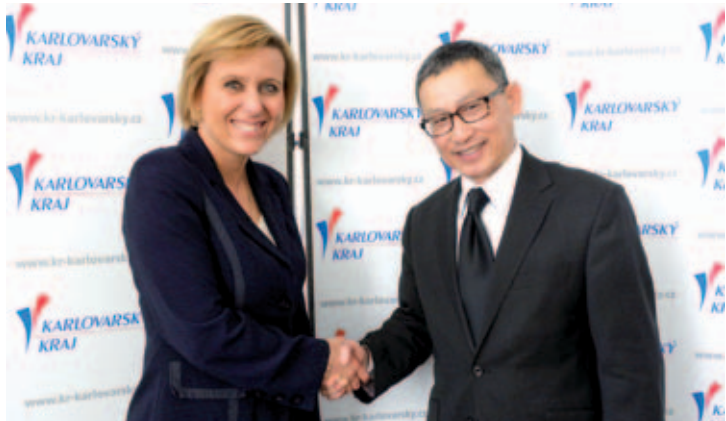
Thajský velvyslanec s paní hejtmankou.

Jedním z probíraných témat byl cestovní ruch, jenž je mezi oběma zeměmi velmi cenný. Každoročně přijede do České republiky na 50 tisíc turistů z Thajska. Kromě toho, že nejčastěji míří do Prahy, nevynechávají ani návštěvu Karlových Varů. „Byli bychom rádi, kdyby turisté z Thajska navštěvovali i další místa v našem kraji, která jistě stojí za zhlédnutí a mají co nabídnout. Velvyslanec se zajímal také o možnosti navázání užší spolupráce. Dle jeho slov se doposud nepodařilo navázat partnerství mezi městy v České republice a Thajsku, což je velká škoda. (zdroj KÚ)