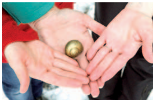
Symbol Domečku.

Od 1.2.2017 jsme novými nájemci bývalé pivnice Vrbičky. Během několika měsíců chceme s vaší pomocí na 140 m 2 vybudovat novou provozovnu Rodinného a komunitního centra Domeček Mariánské Lázně, z.s., které v současné době nabízí své služby pro děti a jejich rodiče v prostorách MěDDM Dráček.