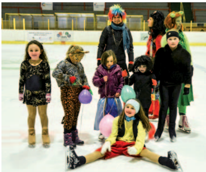
Děti se na ledě dobře bavily.

Oddíl Kraso Mariánské Lázně za podpory města Mariánské Lázně a Karlovarského kraje uspořádal 2. ročník karnevalu na ledě se spoustou soutěží o ceny, překážkovými drahami a občerstvením na zahřátí i pro mlsné jazýčky. (pp)