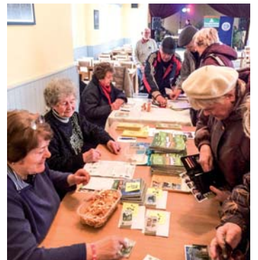
Turisté se dobře bavili až do odpoledních hodin.

Přijďte a neváhejte se s námi podělit o své přírodovědné zážitky a pozorování. Na setkání s vámi se těší organizátoři akce AOPK, RP Správa CHKO Slavkovský les a ČSOP Kladska. (Jana Rolková)