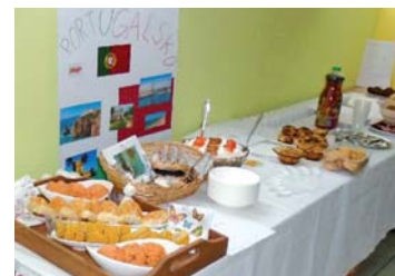
Speciality malých cestovatelů.

V rámci předmětu Informatika se naučili vytvářet prezentace pomocí aplikace PowerPoint. Poté si vybrali jednu z evropských zemí, o které si zjistili důležité informace a zajímavosti, usedli k počítačům a vytvořili prezentaci. Svou práci se museli naučit i odprezentovat. Nejdříve si to vyzkoušeli „mezi svými“ ve třídě. Pak pozvali své spolužáky z nižších ročníků s jejich učiteli a udělali jim zajímavou přednášku o Evropě. Velké finále se konalo ve středu 22. 2. 2017 v podvečer, kdy se všichni žáci se svými rodiči a sourozenci sešli ve škole. Děti s pomocí svých rodičů doma připravily kulinařské speciality různých evropských zemí a přinesly je na ochutnání ostatním. Vznikla tak obrovská tabule plná dobrého jídla a pití z různých koutů Evropy. Jedlo se, pilo a vyprávělo. V této příjemné atmosféře každý žák prezentoval svou zemi. Přestože všichni měli obrovskou trému, moc se jim to povedlo a rodiče byli určitě na své děti pyšní. Odvedly totiž pěkný kus práce. (Mgr. Miluše Hornáková)