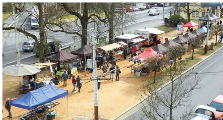
Farmářské trhy ožívují lázeňskou čtvrť. Přinášíme snímky z 11. března 2017.

Po obsáhlé diskusi, ve které dostal slovo i zakladatel parku Radek Míka, zastupitelé neodsouhlasili ani původní návrh na usnesení ani další dva protinávry. Zůstává tedy v platnosti až do roku 2020 smlouva z 1. 1. 2011. (dkp)