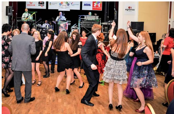
Dobrá nálada vydržela až hluboko přes půlnoc.