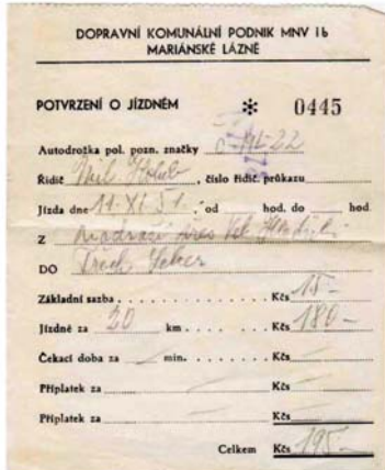
Jízdenka z autodrožky (autotaxi) Dopravního a komunálního podniku Mariánské Lázně vystavená 11. 11. 1951