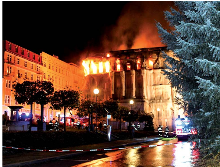
Rozkvět při požáru.

Vedoucímu stavebního úřadu Janu Panošovi jsem položila otázky, které často dostávám od obyvatel M.L. Jak to vypadá se stavbou hotelu Rozkvět a se stavbou multifunkčního domu po zbouraném OD Baťa? „Hotel Rozkvět: stavba se projekčně připravuje. Územní řízení zatím neprobíhá. Stavební úřad nařídil provedení zakrytí štítové zdi. Termínové omezení není. Na místě OD Baťa má vyrůst nový objekt, v současnosti probíhá územní řízení.“ (dkp)