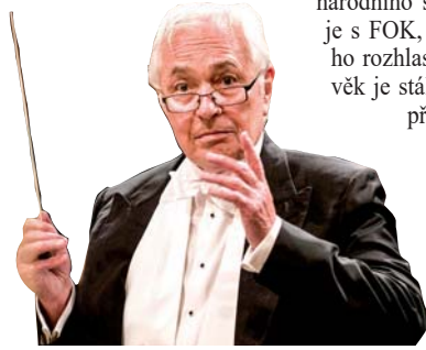
Dirigent Libor Pešek