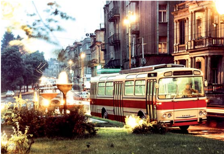
Velmi působivý večerní snímek z roku 1965.