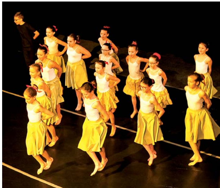
Taneční oddělení ZUŠ.

V představení dohromady účinkovalo téměř 150 žáků ZUŠ Fryderyka Chopina. Účinkování v takovémto typu představení je pro všechny žáky tanečního i hudebního oboru významnou součástí výuky, ale zároveň také cennou zkušeností pro život.