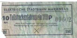
V.M.L. jezdily do r. 1951 tramvaje. Jízdenka je z období 2. sv. války