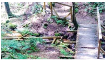
Můstek u Pirátova pramene před opravou.

Rádi bychom poděkovali firmě Lázeňské lesy Mar. Lázně za opravený můstek, zábradlí a odpočívadlo u Pirátova pramene. Za KČT Mar. Lázně Kažková