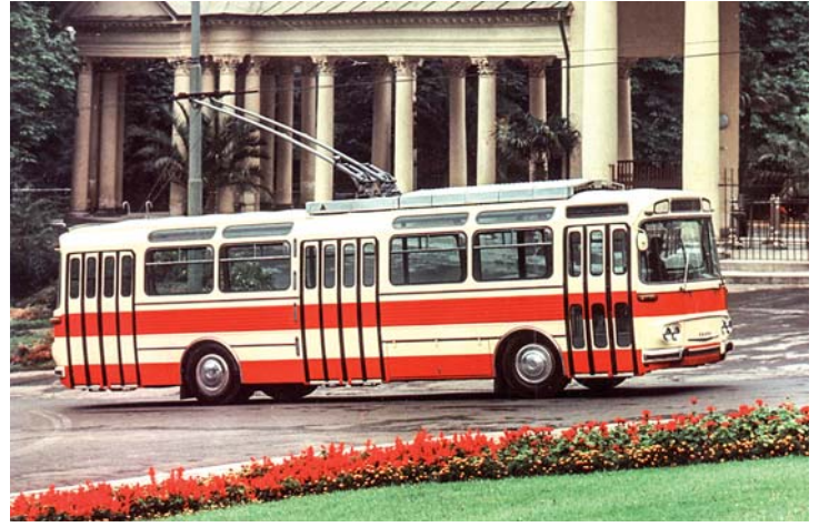
Prototyp T11 u kolonády.