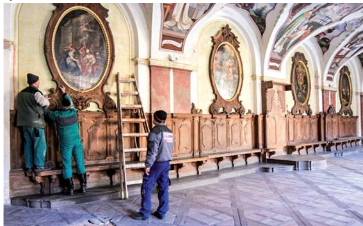
Kapitulní místnost.