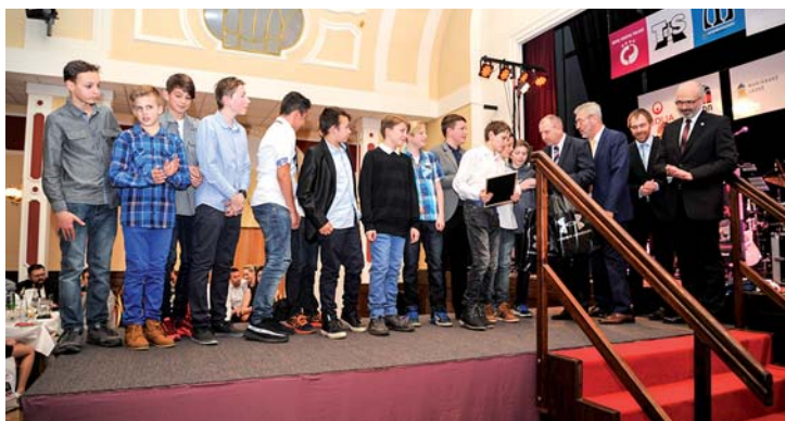
Družstvo mladších žáků FC Viktoria.