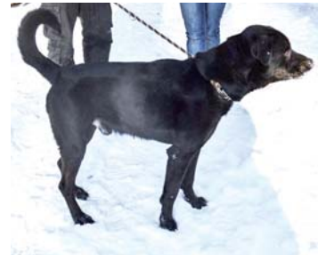
Dingo, asi čtyři roky starý kříženec labradora, čeká se svými psími kamarády na nového pánička v Psím útulku Mariánské Lázně