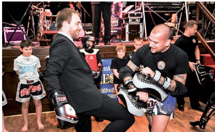
Pan starosta zkouší kickbox.