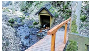
Můstek u Pirátova pramene po opravě.