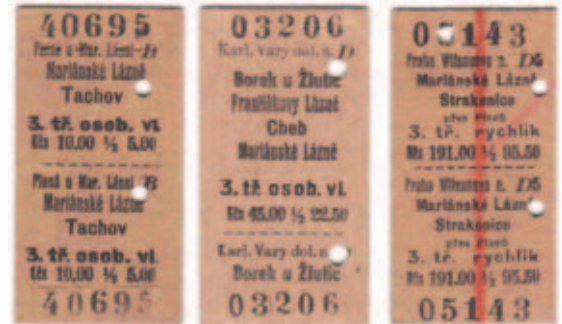
Vlakové jízdenky z roku 1951. Po změně v roce 1953 se na jízdenkách podstatně změnila cenová úroveň

• 1975 – S dopravou v obci můžeme být spokojeni, protože máme spojení na všechny strany ať už autobusem, nebo pak vlakem. Jízdné v autobusu je sice dražší, ale cestování se zdá příjemnější a rychlejší než vlak. (Zdeněk Buchtele)