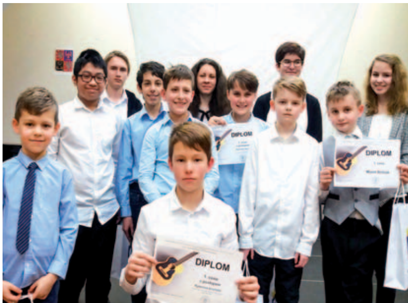
Kytaristé v krajském kole.