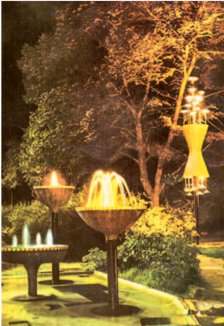
Působivý noční snímek, zachycena je jen část fontánek.