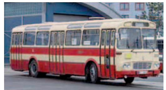
Autobus Škoda SM 112 jezdil až do r. 1984