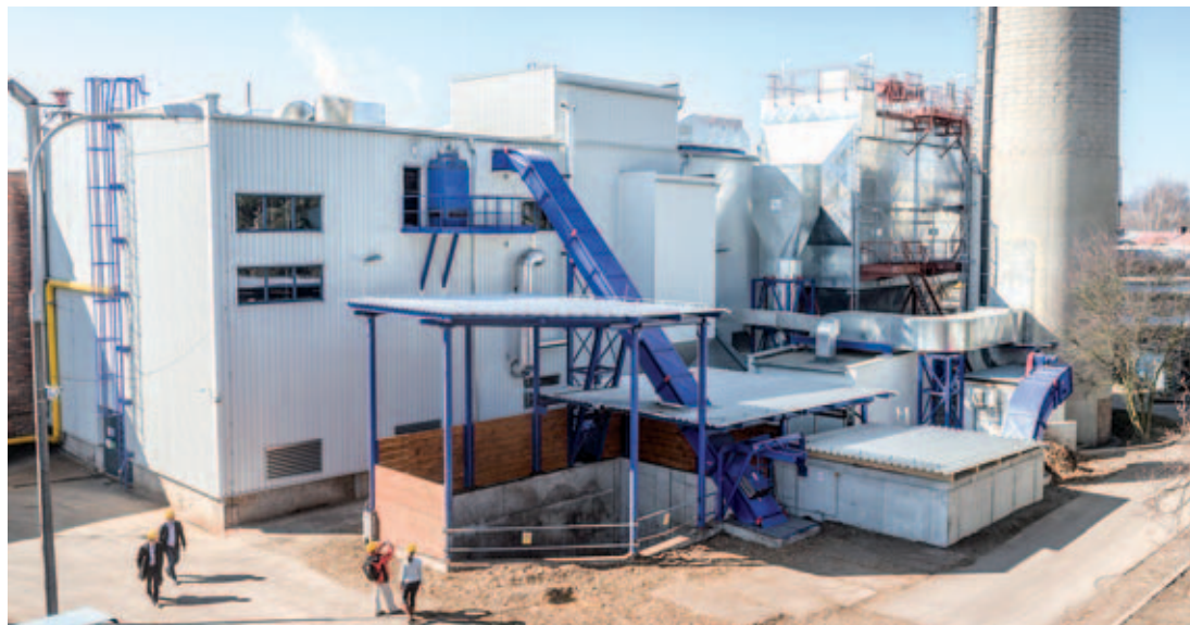
ilustrační foto

Vedle ekologizačních opatření jsou nemalé prostředky vynakládány i na obnovu a údržbu sekundárních sítí, čímž dochází k neustálému navyšování spolehlivosti a efektivity dodávek tepelné energie pro obyvatelé města. (Pavel Kolář)