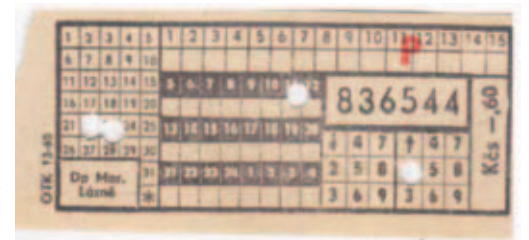
Jízdenka z 60. a 70. let