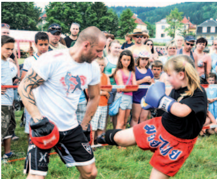
Bojové umění v loňském programu zaujalo i dívky.