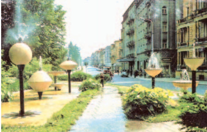
Průhled přes fontánky od Cristalu k Slovanskému domu (nyní Continentalu). Autor snímku neuváděn.