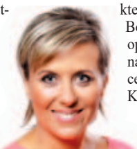
Hejtmanka Jana Vildumetzová.

„Nařízení vlády je velmi nestandardní, vstupuje totiž do vztahu zaměstnavatel a zaměstnanec. Kraje řidiče nezaměstnávají, mají smlouvy s dopravci. Přesto se snaží situaci, za