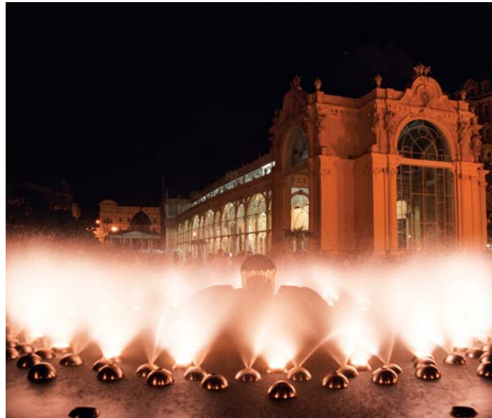
Fontána je krásná v každé denní i večerní době.

Centrální koncertní fontána, která přináší produkci hudby s baletem vody a světla, byla nazvána fontánou Zpívající. Její výstavba probíhala v letech 1982–1986. Zprovozněna byla 30. dubna 1986 a od té doby vždy od posledního dne měsíce dubna láká domácí i hosty na svou hudební produkci. První a dosud nejslavnější skladbu pro mariánskolázeňskou fontánu napsal Petr Hapka, na jehož počest bude v její blízkosti umístěna jeho busta. Na repertoáru jsou ale i další skladby slavných autorů. Letos začaly tančit proudy vody již po jednacího a opět přilákaly doslova davy lidí, i když počasí zrovna neodpovídalo předmájovému večeru. (dkp)