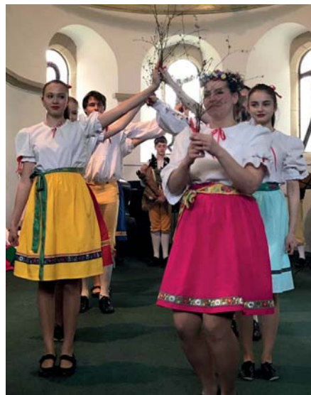
Mariánek vítal jaro.