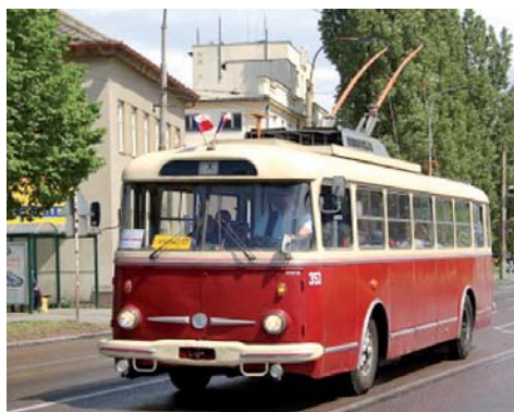
Trolejbus Škoda 9Tr

• 1982 – Od 23. března 1981 do 15. prosince 1982 vydal odbor dopravy KNV v Plzni rozhodnutí o úplné uzavírací silni-