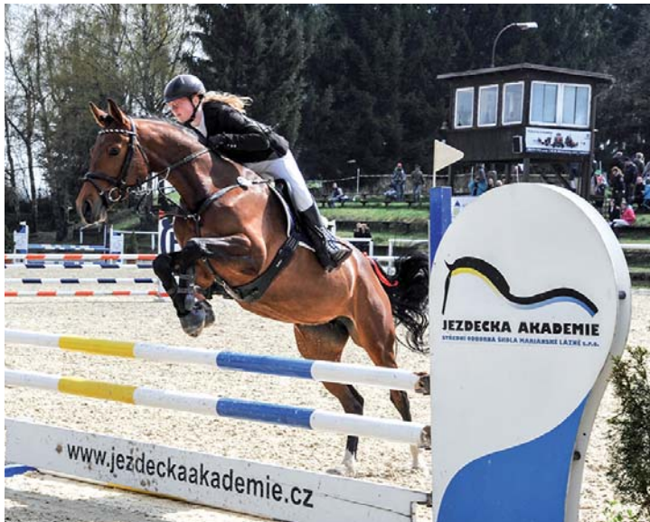
Prvomájové skokové závody.

všechny. Zdolávaly se překážky o výšce od 90cm do 130 cm. Nejmladší závodníci bylo 13 let. Na další podívanou v jezdeckém areálu si počkáme do 16. června, to budou Hobby závody, 17. A 18. 6. Skokové závody CSN, 26. 7. – CSN KMK a 29. A 30. 7. – Memorál ing. Václava Nágra. (dkp)