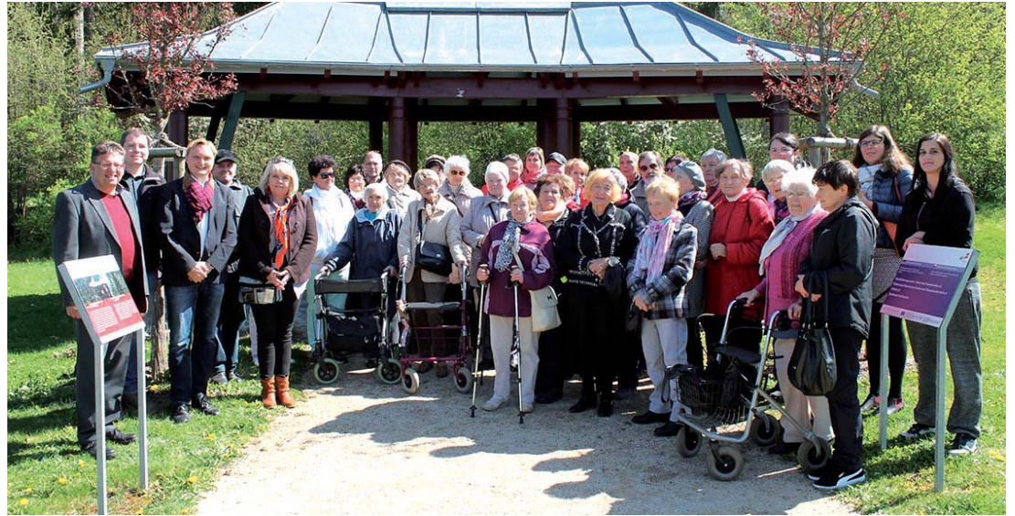
Senioři v Hofu.