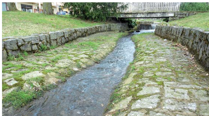
Potok má stále málo vody i po zimě. Řekl bych, že méně než poloviční průměr. Stačí mu jen zúžené koryto při průtoku městským parkem. Snímek z 8. dubna 2017.

☎ 775 980 988, e-mail: nikola.hrda@seznam.cz