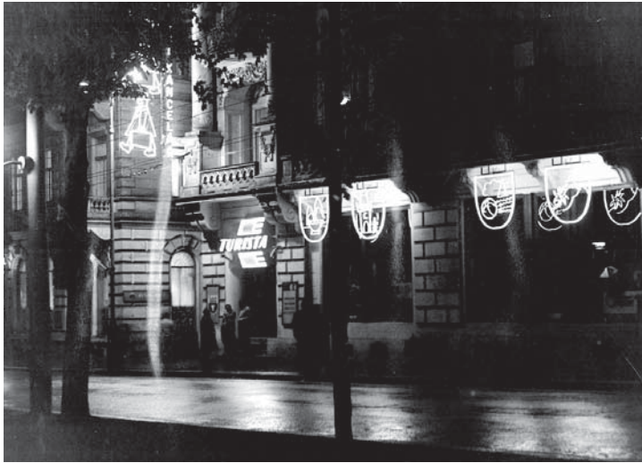
Noční snímek cestovní kanceláře. V té době byl trend světelných (neonových) reklam. Pořízeno kolem roku 1962.