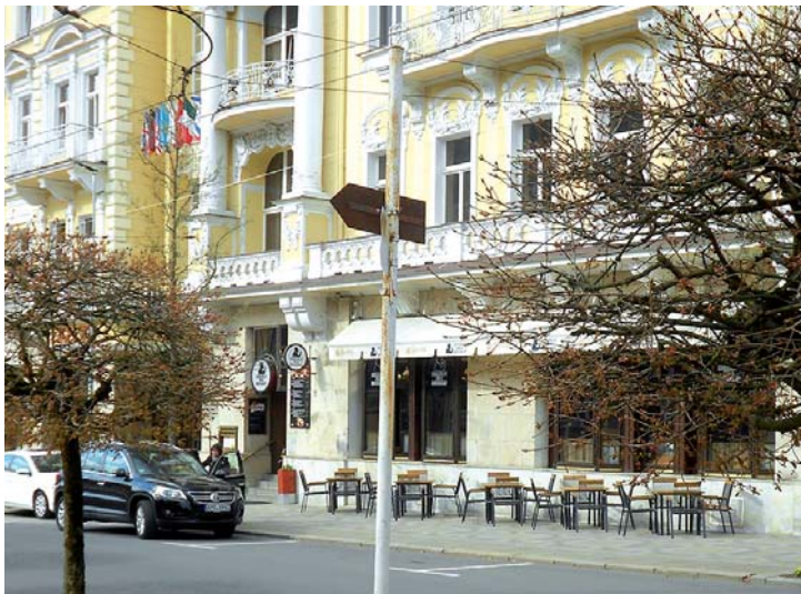
Zde bývala po desetiletí kancelář Čedok - Turista.