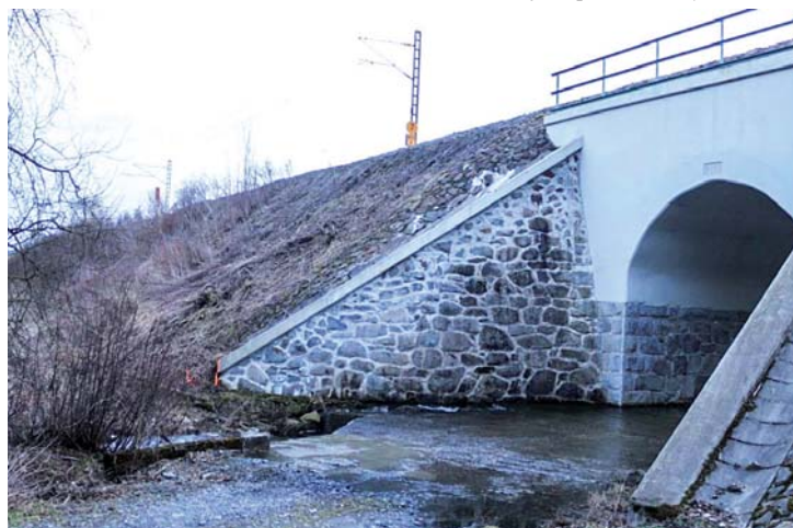
Viadukt s mokřadem.