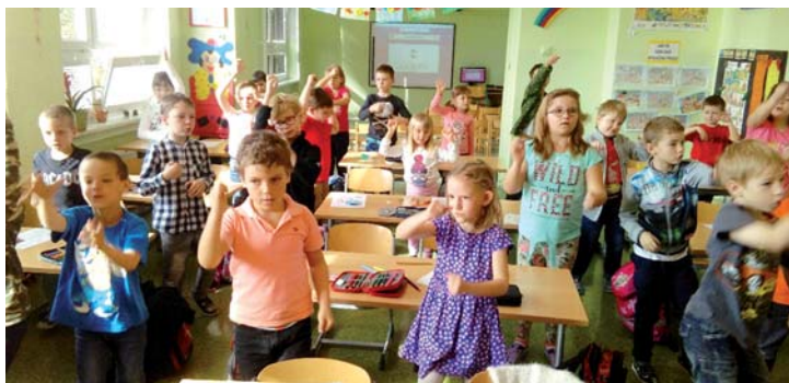
Děti z mateřinky navštívily úšovické prvňáčky.