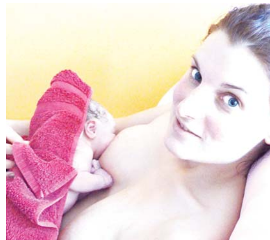
Ilustrační foto

Vše důležité najdete na webových stránkách festivalu www.bit.do/respekt-k-porodu Na setkání s vámi všemi se za organizátory festivalu těší dula ČAD Jana Frajtořová