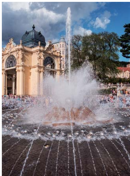
V sobotu 30. dubna večer se po zimní přestávce opět rozsvítila Zpívající fontána.

Během přestavby kolonády započaté roku 1976 byl architekt Pavel Mikšík pověřen vypracovat výtvarné návrhy na tři fontány.