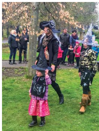
Malé, větší i dospělé čarodějnice měly v sobotu přer.