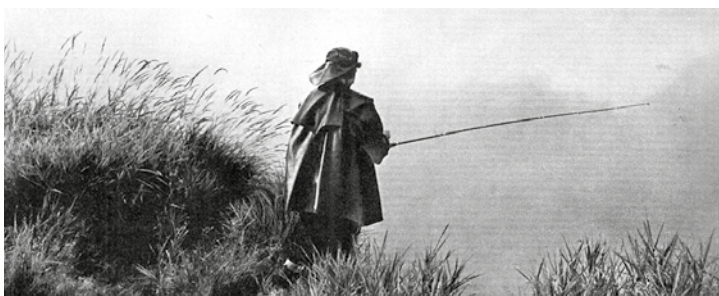
Rybář v oparu Regentu. Z publikace (1960) o Mariánských Lázních. (Autor Erich Einhorn, sbírka Václav Kohout)