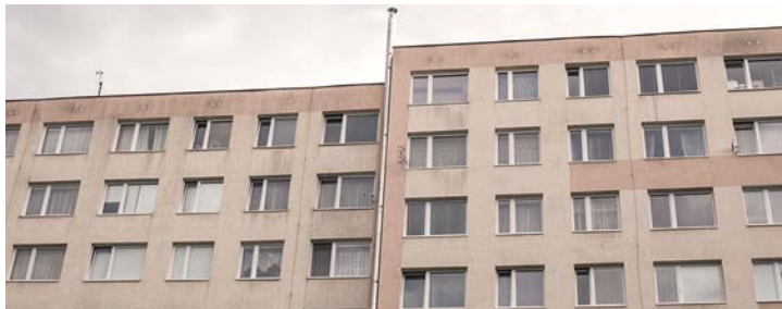
Panelový dům v pražských Řepích.

Jaký je rozdíl ve vyúčtování? Jako spotřebitelé mě samozřejmě nejvíc zajímá, kolik zaplatím. Při napojení na centrální topení jsme za teplo v bytě platili kolem 24 600 korun ročně. Po instalaci plynového kotle měly náklady klesnout. Realita je ale taková, že za teplo platím víc skoro o šest tisíc korun ročně. Dříve jsem při stejných zálohách měla přeplatky, letos mám nedoplatek.