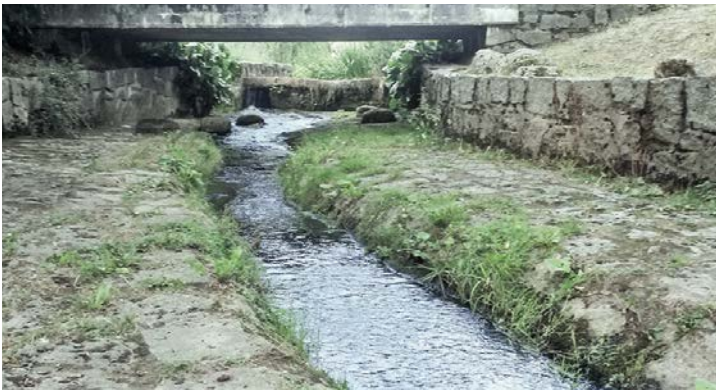
Srpnový stav vody.