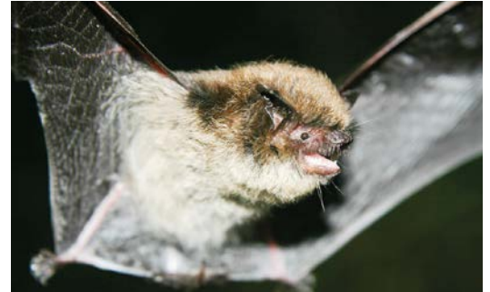
Noc pro netopýry.