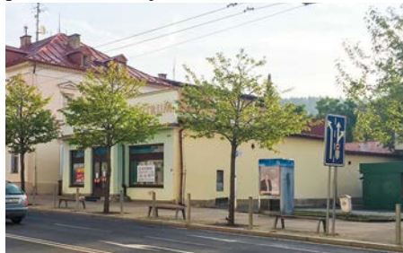
Stávající prodejna textilu, kde otevře prodejna Baťa.

Prodejna obuvi Baťa, která s demolicí Baťova paláce v roce 2015 z města zmizela, se opět do Mariánských Lázní vrátí. Nebude to však na kdysi tradičním místě rohové budovy na Hlavní třídě, ale u Chebské křižovatky vedle stávající drogerie. S otevřením nové prodejny se počítá během října.