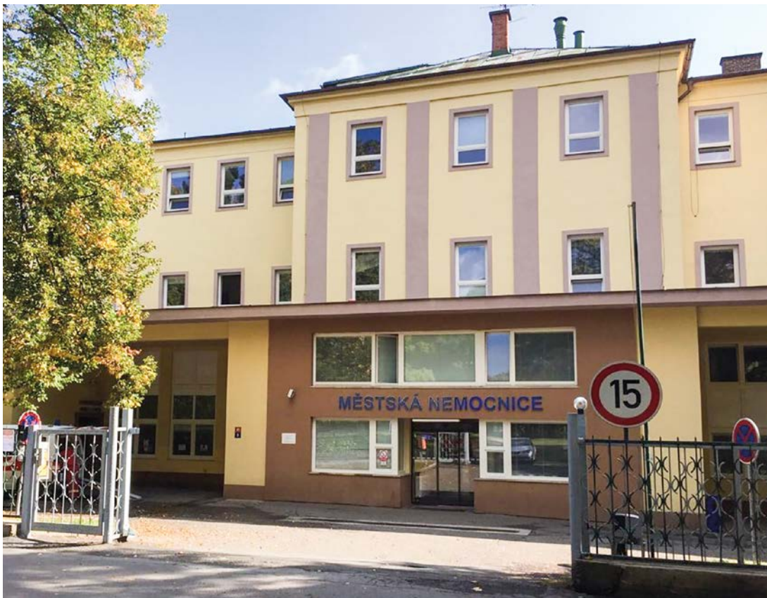
Nemocnice Mariánské Lázně.