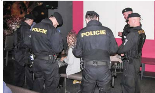
Policisté provádí kontrolu v rámci akce HAD.

V Mariánských Lázních proběhla kontrola ve večerních hodinách v pátek 31. srpna. Podle policejní mluvčí byly do akce zapojeny asi tři desítky policistů a strážníci namátkově navštívili devět restauračních zařízení. Během akce zkontrolovali okolo 30 osob. „Výsledkem večerní akce v Mariánských Lázních bylo zjištění alkoholu u osob mladších osmnácti let, a to ve čtyřech případech. Nejvyšší naměřená hodnota alkoholu byla přes 0,50 promile,“ uvedla policejní mluvčí Soňa Hergezelová.