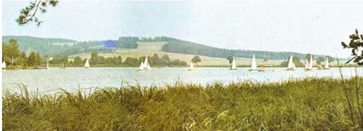
Náladový snímek z publikace Dopravního podniku (1977). V pozadí jachty, tehdy běžný letní obrázek. Regent v době sportovní slávy. V té době byl Regent častěji fotografován.

V dobových novinách (koncem Rakousko-Uherska) se dočteme, že populární býval v době výlovu. Tehdy (i později) byla zvyklost, že po ukončení výlovu zazněla trubka, poté mohl kdokoliv vylovit ryby uvízlé v bahně. - Poprvé byl napuštěn 1479. Uvádí se plocha 52 hektarů, ta se ale zmenšuje zanášením hlavního přítoku (Ize vidět z vlaku). Přístupnějším se Regent stal po 1927. Předtím se klikatila polní cesta od Sklářů k Regentu. Ta se narovnal a vyasfaltovala kvůli letišti. Pozůstatkem původního stavu je tzv. „malý Regent“ přefatý asfaltovou silnicí (ta má nyní číslo 230). Tůňka zarůstá, je však stále patrná, ač je oddělena už 90 let. (Václav Kohout)